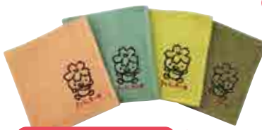
今治タオルハンカチ 各 600円 (ピンク・ターコイズ・イエロー・グレー)