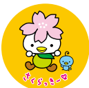
マグネットシート(小) 各 100円