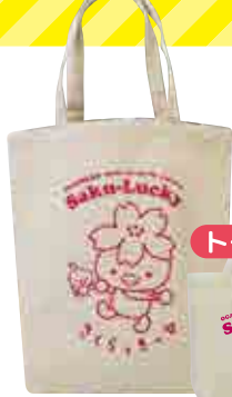
トートバッグ 大 800円 小 600円