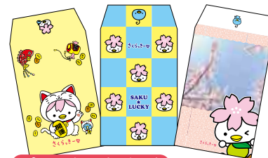
ポチ袋各種(3枚入) 各 150円