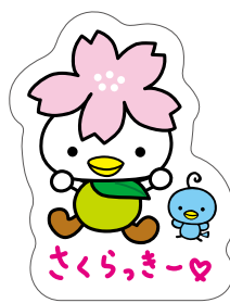
マグネットシート(大) 各 350円