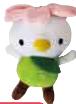
ぬいぐるみストラップ付 600円