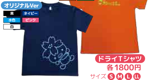
ドライTシャツ 各 1800円 サイズ S M L LL