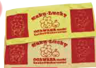
マフラータオル 各 750円 (イエロー・ピンク 120cm×21cm)