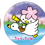
缶バッジ 各 100円 ※他にもいろいろなイラストがあります。